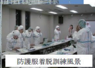
防護服着脱訓練風景