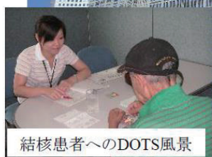
結核患者へのDOTS風景

東京都の公衆衛生を担う、やりがいのある仕事です。経験は問いません。また、入職前に公衆衛生を専門的に学んでいなくても、研修や先輩医師のサポートがありますので、はじめての方でも安心して働くことができます。地域住民の生命と健康を守るため、一緒に取組んでみませんか？