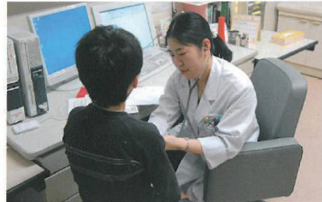
▶▶▶ 医療機関での研修の様子 【大阪府立急性期・総合医療センター】